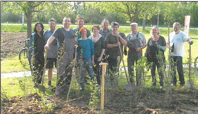
Danke an die fleißigen Helfer!