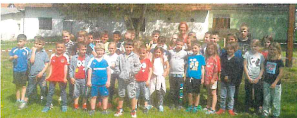
Danke an die fleißigen Helfer!