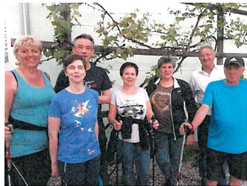
Die Nordic Walkinggruppe.....

Wollschweine, Puszta, Graurinder, Ochsen – wenn man nicht an die Zahnbehandlung in Ungarn denkt, ist die ungarische Puszta im Land wohl einer der bekanntesten Begriffe, wo man ein feuriges Gulasch und rassige Zigeunermusik kennen lernt.