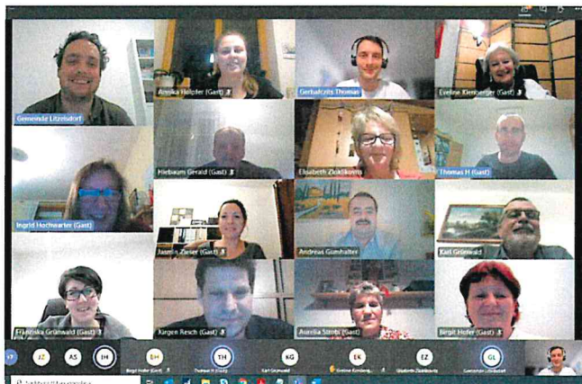
Bild der 1. Online-Gemeinderatssitzung in Litzelsdorf

Die Gemeinde Litzelsdorf hat gemeinsam mit der Feuerwehr Litzelsdorf 1.000 Stück FFP2-Masken für die Bevölkerung angekauft. Wer eine FFP2-Maske benötigt, kann sich eine im Gemeindeamt abholen. Pro Person werden max. 2 Stk./Monat zur Verfügung gestellt.