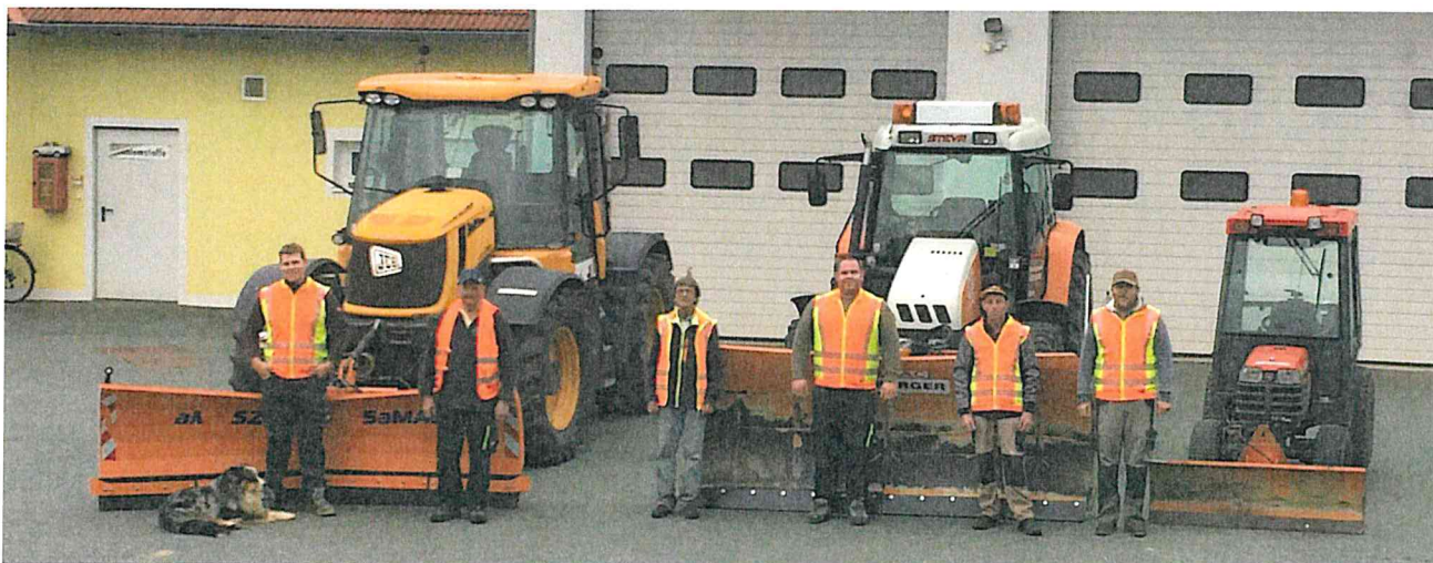
Der Fuhrpark für den Winterdienst und die Mitarbeiter

Auch wenn es die bisherige Wetterlage nicht vermuten lässt sind wir für einen eventuellen Wintereinbruch gerüstet.