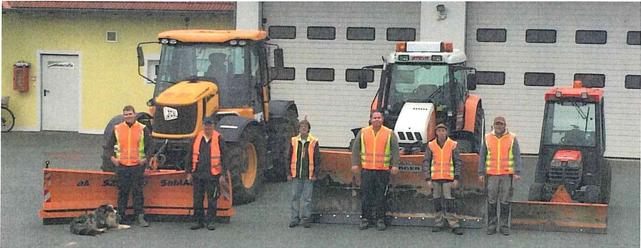
Der Fuhrpark für den Winterdienst und die Mitarbeiter

Auch wenn es die bisherige Wetterlage nicht vermuten lässt sind wir für einen eventuellen Wintereinbruch gerüstet.