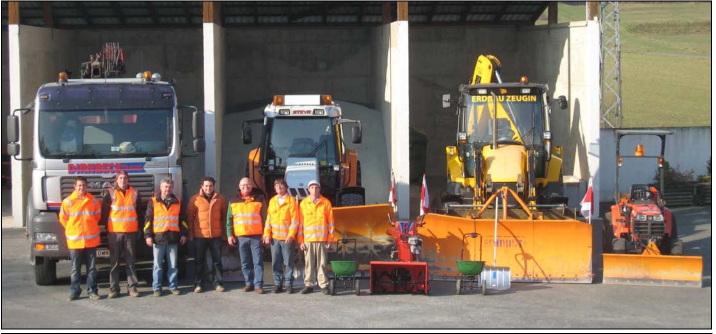
Der Fuhrpark für den Winterdienst und die Mitarbeiter

Auch wenn es die bisherige Wetterlage nicht vermuten lässt sind wir für einen eventuellen Wintereinbruch gerüstet.